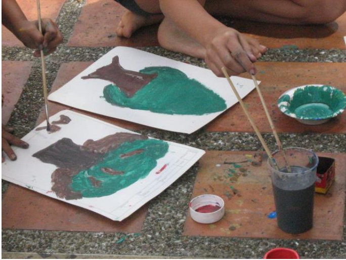
Institución Diego Echavarría Misas